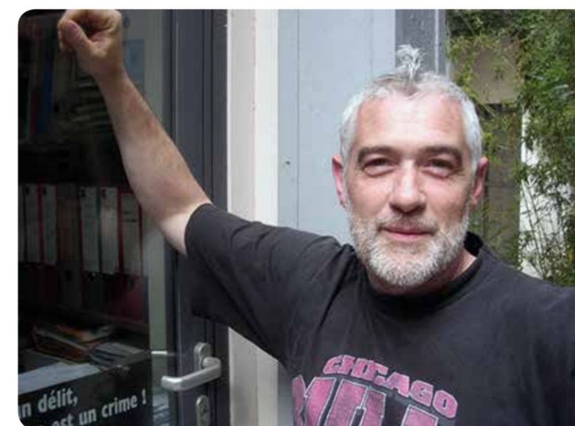
MEMORIA DEL ABBÉ PIERRE Y DEL MOVIMIENTO Laurent Kaeuffer, Emaús Touraine (Francia)

«Todas las cuestiones sociales a las que hacemos frente en nuestros grupos Emaús constituyen, ante todo, cuestiones políticas. No podremos luchar contra la miseria, las injusticias o la pobreza sin actuar contra sus causas políticas. Siguiendo los pasos del Abbé Pierre y de su llamamiento de 1954, debemos denunciar todas las violaciones de derechos y trabajar con los más pobres para que recuperen sus derechos. En Emaús, nuestro trabajo diario debe continuar centrándose en la acción política, al mismo nivel que la acción social. Recuerdo que, durante una visita a Burkina Faso, el Abbé Pierre llamó la atención de la ministra con una sencilla pregunta: «¿Qué tienen pensado hacer por los más pobres?». Creo que la incidencia política empieza a escala local: cada grupo Emaús debería aprovechar todas las ocasiones que tenga para dirigirse a sus dirigentes políticos locales. A escala regional, sería interesante contar con personas que se encarguen de la formación y de la incidencia política».