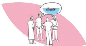
La sensibilisation aux risques et aux dangers de la migration auprès des populations locales