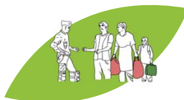
Le plaidoyer auprès des autorités locales ou nationales