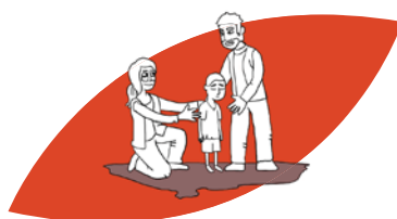
L'assistance aux populations vulnérables