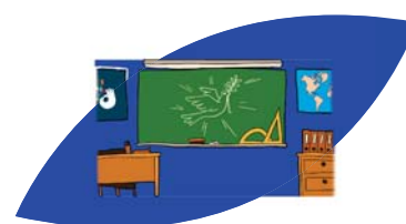
La lutte contre les discriminations et les préjugés