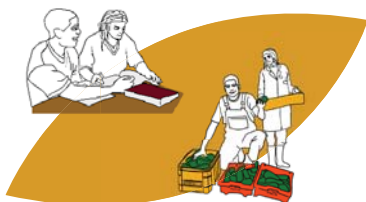
L'accompagnement social, l'insertion par le travail, l'accueil des migrants