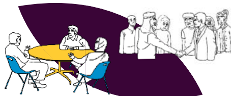
La médiation sociale et communautaire, la résolution des conflits intra/inter-communautaires