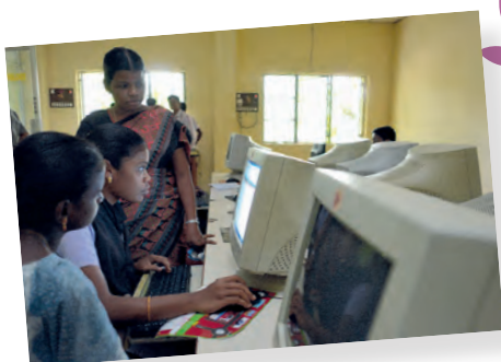
Formación para luchar contra las desigualdades. Tara projects - India