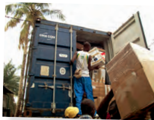
Descarga. Emaús Jekawili - Costa de Marfil