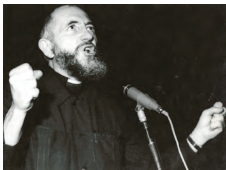
La «voz de los sin voz». Beirut - 1959