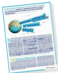
Texto fundador votado en 1969.