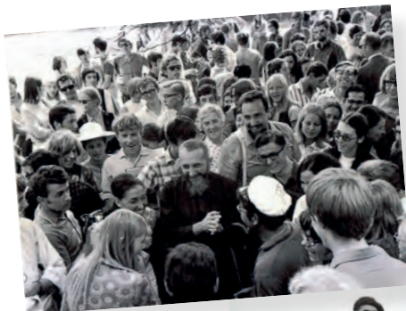
Dinamarca - 1963