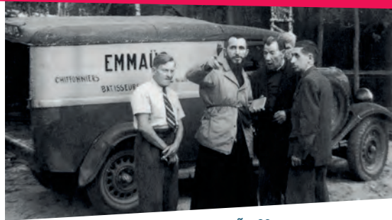
El Abbé Pierre y los primeros compañeros. Francia - 1953.