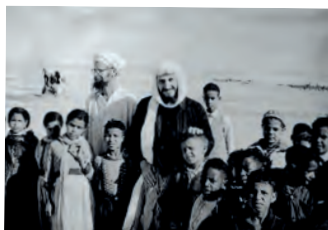
Sáhara - 1962