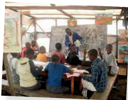
Acogida de antiguos niños soldado, para desarrollar con ellos perspectivas de futuro. Emaús CAJED - RD Congo