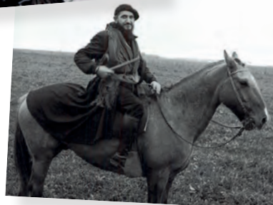
Argentina - 1959