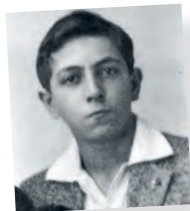
El Abbé Pierre a los 15 años

Vivir el legado del Abbé Pierre mediante la valorización de sus archivos.