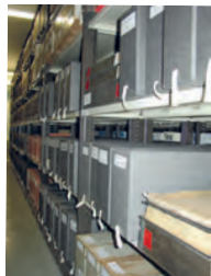
Miles de archivos por tratar todavía.

Es mejor un acto pequeño que un sueño grande y hermoso que nunca llegue a convertirse en realidad. Será a través de la acción como conseguiremos cambiar el curso de los acontecimientos. Esa es la verdadera solidaridad».