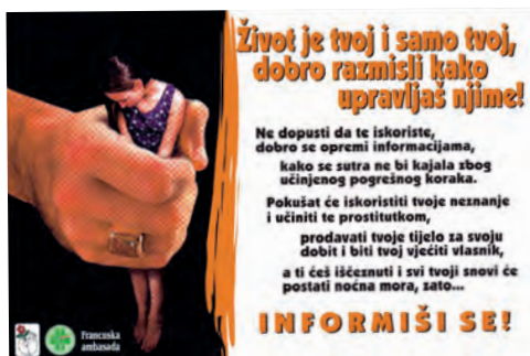
Campaña de sensibilización y denuncia de la trata de seres humanos. Emaús FIS - Bosnia