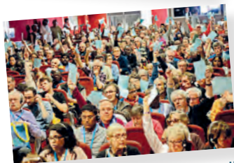
1 grupo = 1 voto. Asamblea Mundial. Italia - 2016.