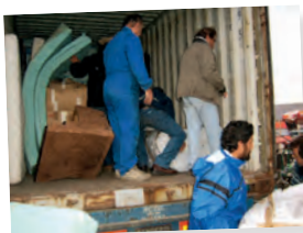
Carga. Emaús Angoulême - Francia

La solidaridad a través de la puesta en común de recursos. Material recogido en Europa Occidental y enviado para revender en América Latina, África y Europa del Este.