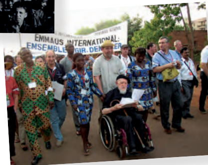
Una lucha incesante por la libertad. Burkina Faso - 2003