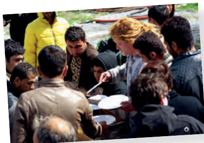
Apoyo moral, logístico, jurídico y político a los migrantes. Calais - Francia