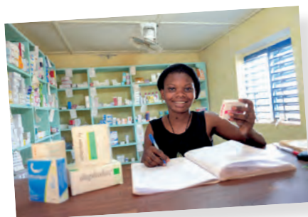
El acceso a los cuidados para las personas más excluidas. Mutuas de salud en Benín, India y Burkina Faso. Emaús Pag-la-Yiri - Burkina Faso