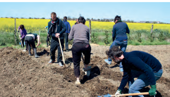
La tierra, un bien común para compartir y proteger. Emaús Toulouse - Francia