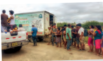
Apoyo a víctimas de inundaciones. Emaús Piura - Perú

Para una respuesta rápida y eficaz a situaciones excepcionales.