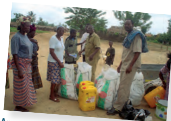
Apoyo a refugiados extranjeros. Emaús Mars ONG - Togo