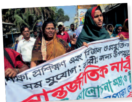
Conocer sus derechos para defenderlos mejor. Emaús Thanapara - Bangladesh

Vivir la solidaridad como un compromiso político: el Abbé Pierre nos transmitió este principio de acción desde el momento mismo de la creación de Emaús Internacional. Así, ya en sus orígenes, el movimiento participó en la transformación estructural de nuestras sociedades, para favorecer y conseguir la «destrucción de las causas de todas las formas de pobreza» y el «acceso a los derechos fundamentales para todas las personas» (Manifiesto Universal de Emaús, 1969).